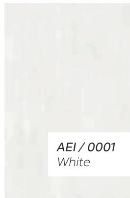
AEI / 0001 White