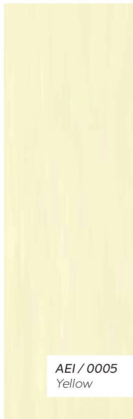
AEI / 0005 Yellow